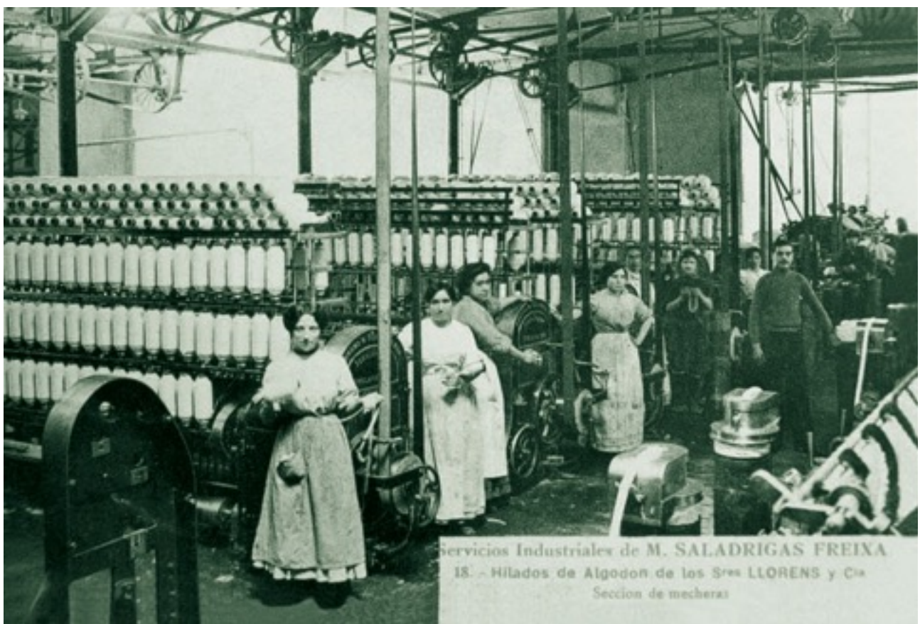
Fotografia interior de Can Saladrigas 5 .

Partim del compromís amb els ciutadans i associacions que van participar activament en aquestes iniciatives. Mostrem la relació de persones participants en el procés de Salvem Can Ricart. La investigació fins al moment ens ha fet arribar a la signatura de les persones que van presentar la carta al president de la Generalitat al 2005, però volem anar més enllà. Volem donar cabuda a tots i totes els que ho van fer possible. Gràcies a la seva implicació no només es va salvar part del patrimoni industrial de Poblenou, en part el patrimoni intangible de les accions de tants artistes, veïns, treballadors que conviuen en aquest entorn, sino la continuïtat amb la vida artística vinculada al territori. Per a nosaltres queda representada pels Tallers Oberts de Poblenou en vigència des del 1996.